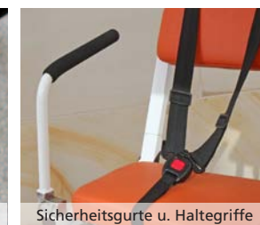
Sicherheitsgurte u. Haltegriffe