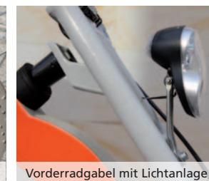
Vorderradgabel mit Lichtanlage