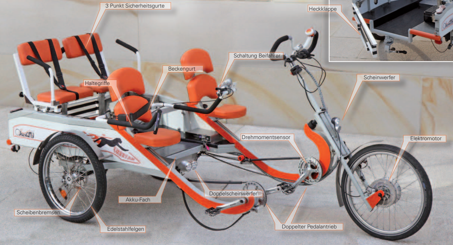
Abb. Prototyp K2, technische Optimierungen vorgesehen! Stand November 2011

Kostenlose Probefahrt sichern! In einer Farbe nach Wahl bestellen!