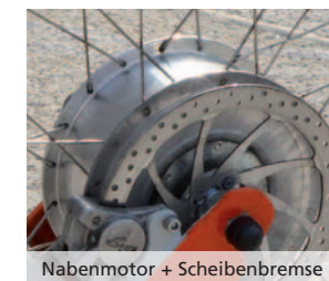
Nabenmotor + Scheibenbremse